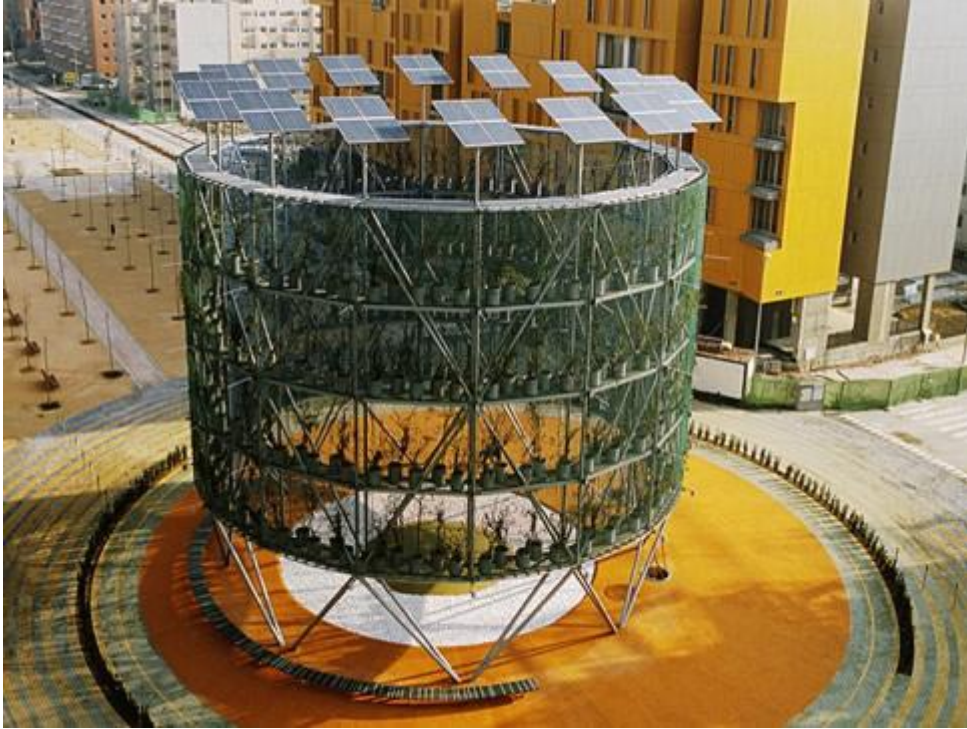
Abb.: „Air Tree“ Madrid

Es gab aber auch internationale Beispiele von erfolgreichen partizipativen Planungsprozessen, wie z.B. für eine Wohnanlage in Chile oder auch das Projekt „Air Tree“ in der Innenstadt von Madrid, bei dem ein innovatives Bürgerzentrum realisiert wurde, das als Treffpunkt, als Konzerthalle usw. fungiert, siehe folgendes Bild.